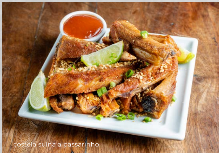
costela suína a passarinho