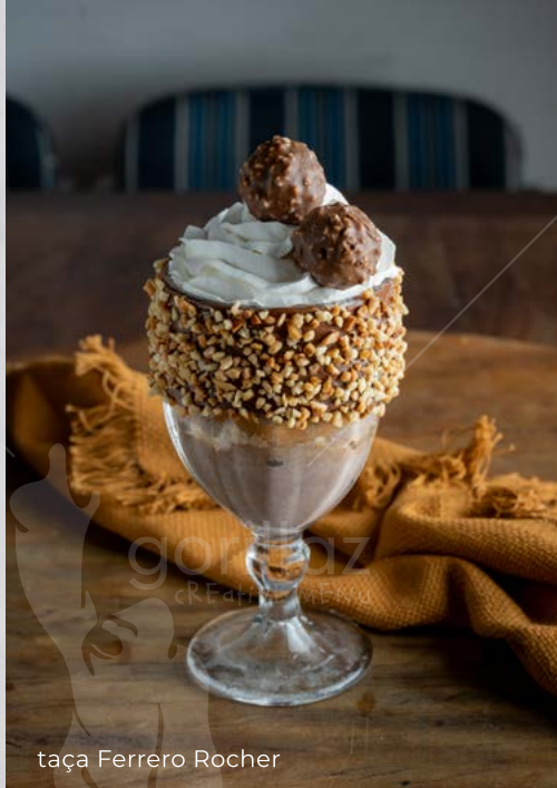
taça Ferrero Rocher