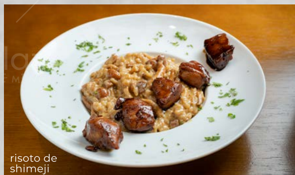
risoto de shimeji