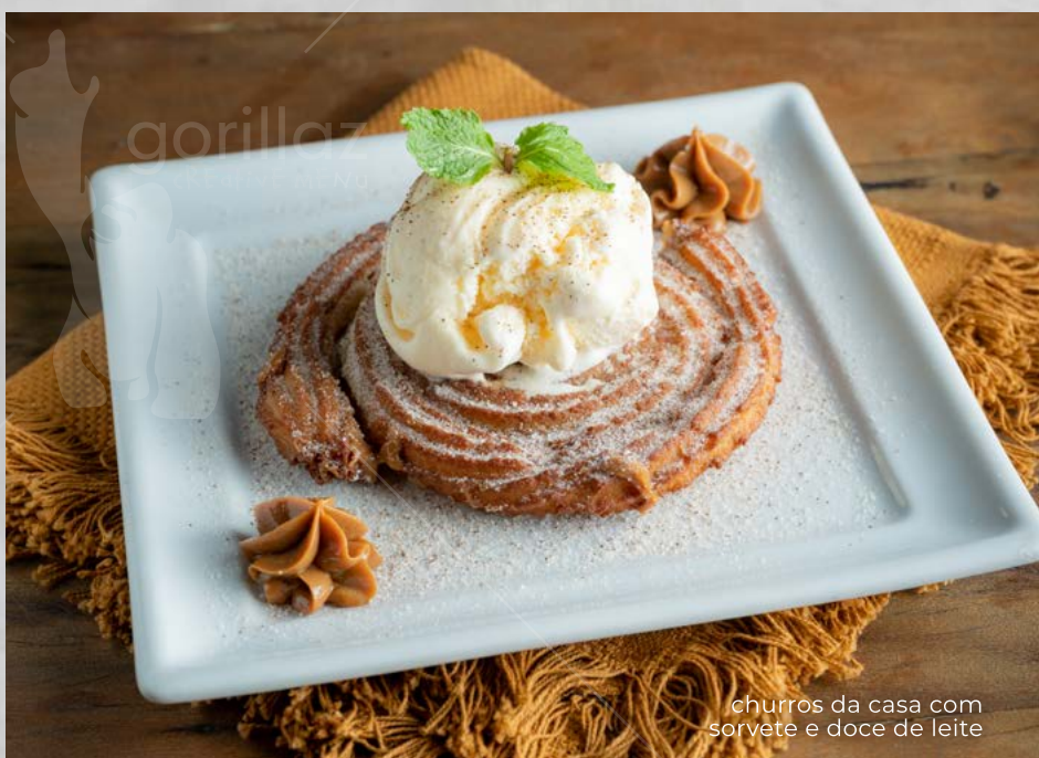
churros da casa com sorvete e doce de leite