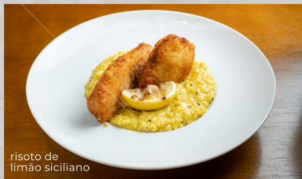
risoto de limão siciliano