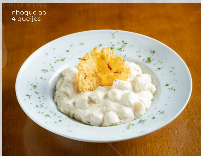
nhoque ao 4 queijos