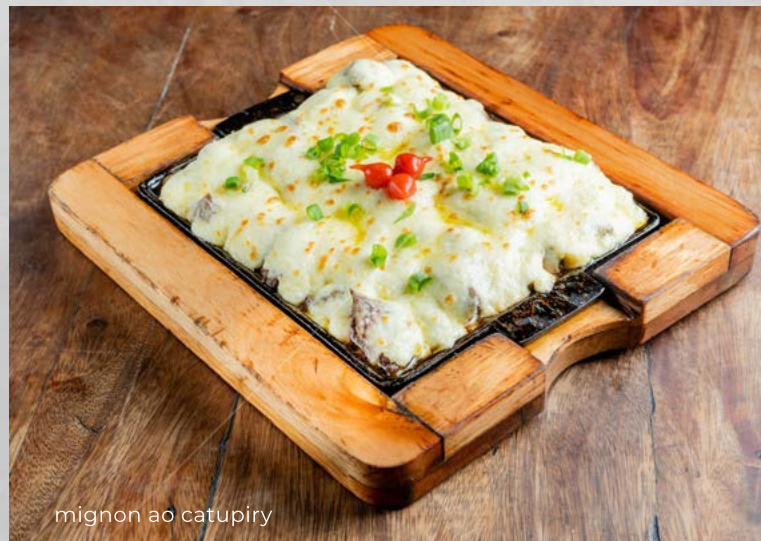
mignon ao catupiry