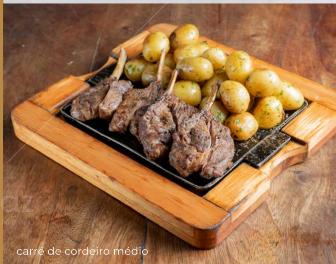
carré de cordeiro médio