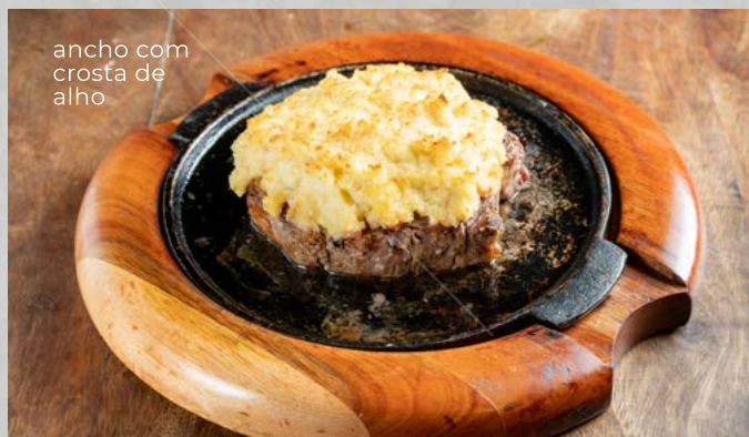
ancho com crosta de alho