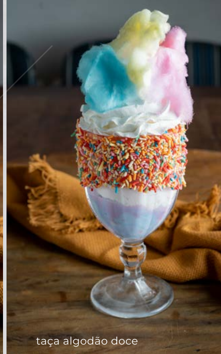
taça algodão doce