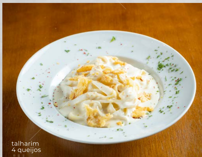
talharim 4 queijos