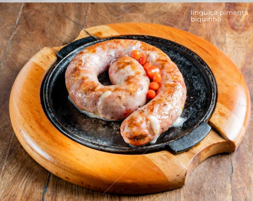
linguiça pimenta biquinho