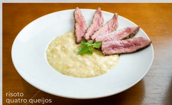
risoto quatro queijos

537 RISOTO DE CARNE SECA COM QUEIJO COALHO 49,90 Acompanha abóbora assada