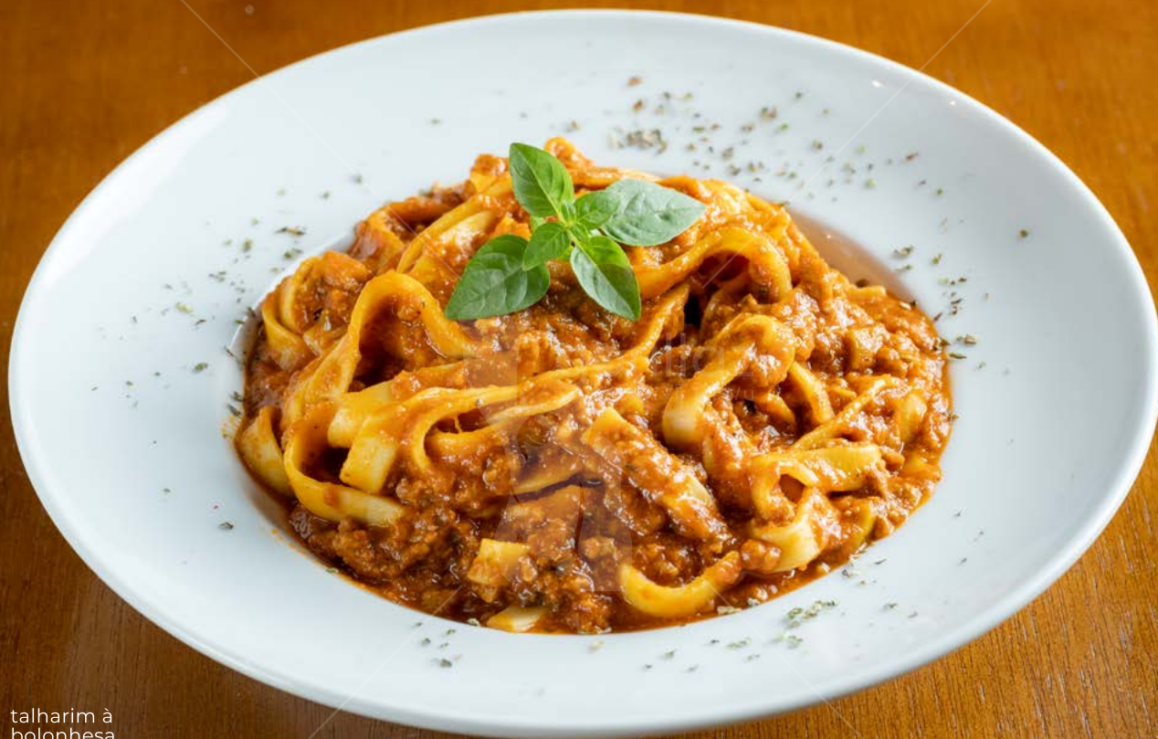
talharim à bolonhesa