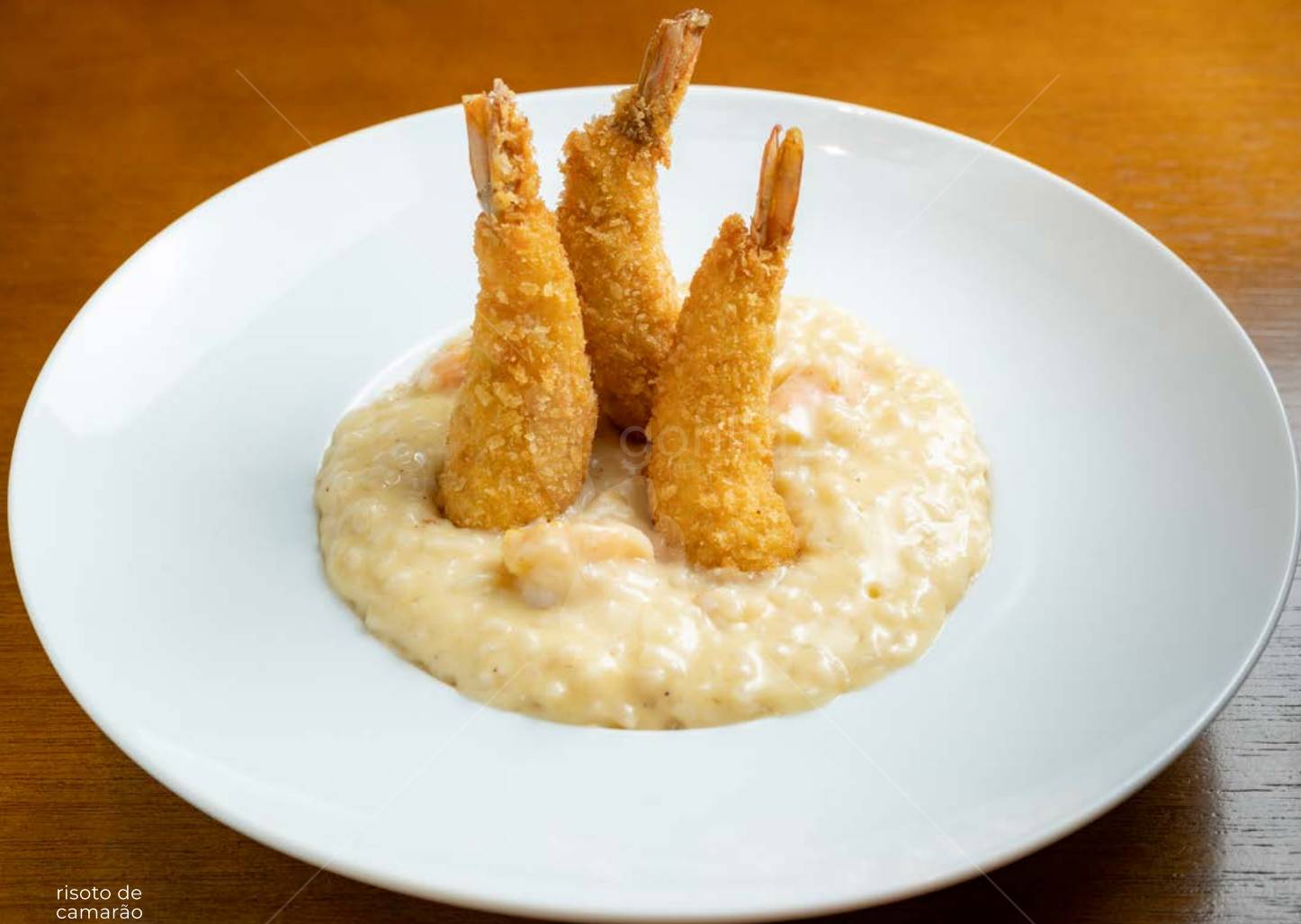
risoto de camarão