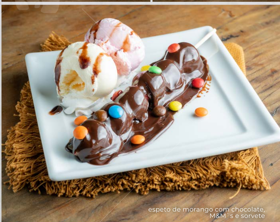
espeto de morango com chocolate, M&M's e sorvete