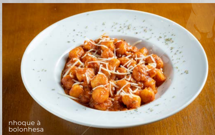
nhoque à bolonhesa