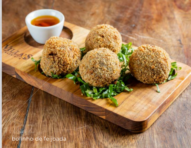
bolinho de feijoada